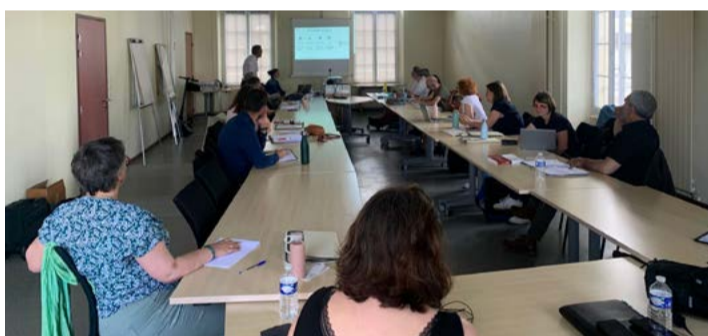
Séminaire RIA du 25 juin 2024.

La PFRH a organisé un séminaire Restauration destiné aux présidents des restaurants inter-administratifs (RIA), aux membres des conseils d'administration et aux membres de la commission restauration de la SRIAS Pays de la Loire le mardi 25 juin.